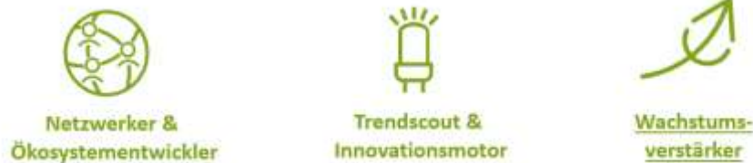
Abbildung 12: Rollen des Green Tech Clusters

Die etablierten Rollen als Netzwerker & Ökosystementwickler, Trendscout & Innovationsmotor sollen weiter ausgebaut werden.