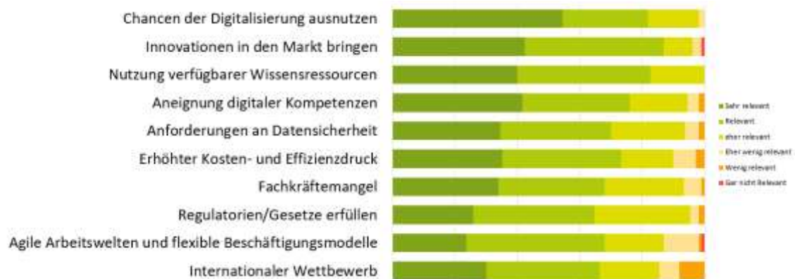
Abbildung 5: Was sind die künftigen Herausforderungen für Ihr Unternehmen?

Im Zuge der Online-Umfrage wurden Unternehmen zu ihrer Einschätzung zur Marktentwicklung bis 2025 befragt. Das Ergebnis zeigt eine hohe, positive Dynamik in Märkten, Unternehmen und Forschung. In Hinblick auf künftige Marktentwicklungen werden für die Unternehmen vor allem Digitalisierung, Klimaschutz und ein Boom grüner Technologien als besonders wirksam.