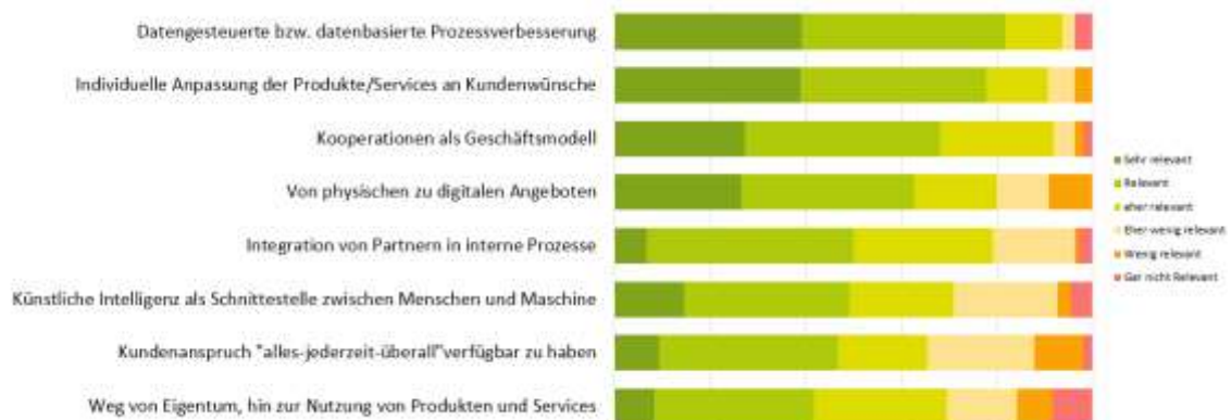
Abbildung 6: Welche Trends werden für Sie wie relevant werden?

In Hinblick auf künftige Herausforderungen und Trends zeigt die Befragung, dass vor allem Digitalisierung, neue Innovationen sowie die Nutzung von Wissensressourcen von den Unternehmen als Herausforderungen gesehen werden. Zukünftig wollen die Unternehmen vermehrt auf datenbasierte, maßgeschneiderte und kooperative Geschäftsmodelle setzen.