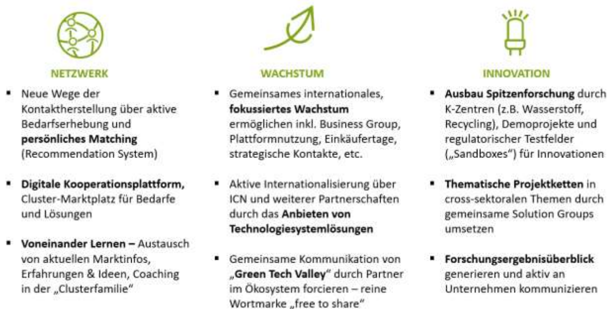
Abbildung 13: Neue Services des Green Tech Clusters