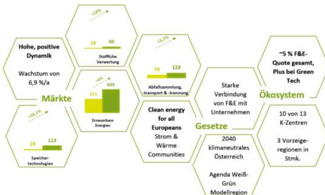
Abbildung 3: Zusammenfassung Analyse

Im Zuge des Strategieprozesses wurden Analysen in den Bereichen Märkte, Trends und Ökosystem durchgeführt. Dazu wurde eine Online-Befragung durchgeführt, im Zuge derer 89 Unternehmen wertvollen Input gaben.