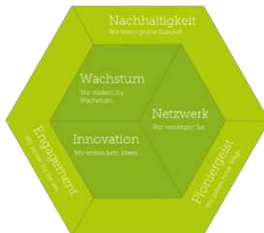
Abbildung 2: Markenwerte – dafür steht der Green Tech Cluster

Green Tech Cluster wirkt. Die Cluster-Partner beurteilen die Leistungen des Green Tech Clusters laut aktueller Erhebung mit der Durchschnittsnote 1,4 auf sehr hohem Niveau – 0,1 Punkte unter dem Höchstwert. Jedes Jahr initiiert der Cluster mehr als 20 Innovationsprojekte mit, generiert über 1.000 Ideen in Unternehmen und stellt mehr als 1.000 B2B-Kontakte her. Dabei entstehen am Markt etablierte Innovationen, wie zum Beispiel ein spezielles Fass zum Sammeln von Lithium-Ionen-Batterien oder neue Heizsysteme. Das macht den Cluster zu einem effektiven Partner für die grüne Zukunft.