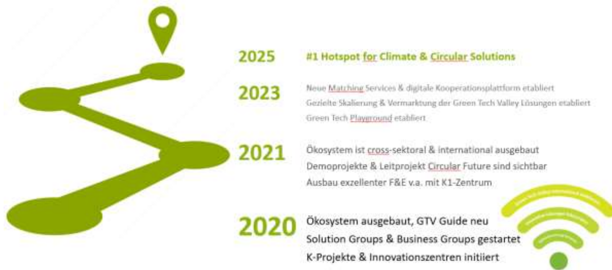
Abbildung 14: Roadmap zur Strategieumsetzung