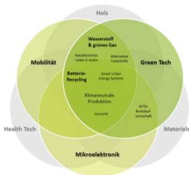
Abbildung 11: Cross-sektorale Einbettung der Handlungsfelder

Weiters werden Veranstaltungen wie Cluster-Treffen, INNOlounge etc. gemeinsam durchgeführt. Jenseits der konkreten Projekte erfolgt die Abstimmung mit den anderen Clustern rund quartalsweise.