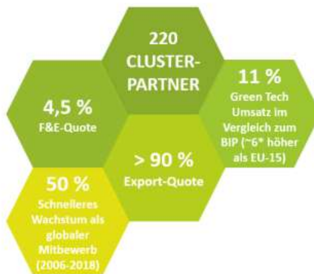
Abbildung 1: Wachstum der Green Tech Cluster Unternehmen

Die Unternehmen erwirtschafteten im letzten Jahr 5 Mrd. € Umsatz rein in der Umwelttechnik (Umsätze inkl. anderer Geschäftsbereiche 11 Mrd. €) mit 25.000 Umwelttechnik-Jobs. Das entspricht rund 11 % des steirischen BIPs. In 10 Jahren haben die Cluster-Unternehmen die Beschäftigung verdoppelt und die Umsätze verdreifacht. Dieses Wachstum ist 50 % schneller als die Umwelttechnik-Weltmärkte. Die Unternehmen haben im Schnitt mehr als 1.000 zusätzliche Green Jobs pro Jahr (in- und außerhalb der Steiermark) generiert. Weitere Beschäftigungseffekte durch Lieferanten & B2B-Kunden vor Ort kommen zusätzlich hinzu.