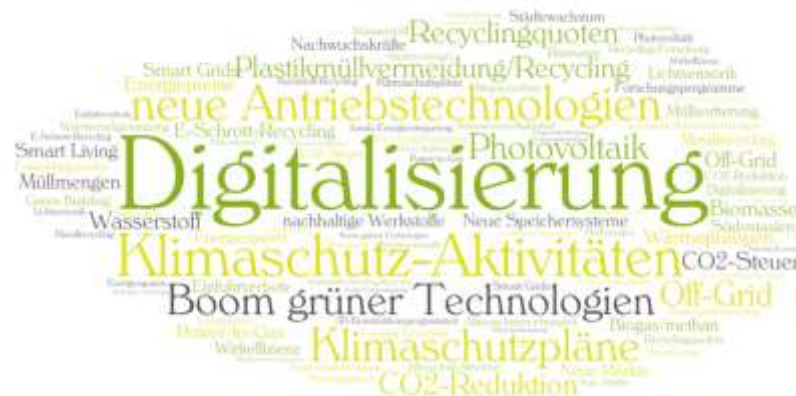
Abbildung 4: Welche Marktentwicklungen werden für Sie bis 2025 besonders wirksam?

Im Zuge des Strategieprozesses wurden Analysen in den Bereichen Märkte, Trends und Ökosystem durchgeführt. Dazu wurde eine Online-Befragung durchgeführt, im Zuge derer 89 Unternehmen wertvollen Input gaben.