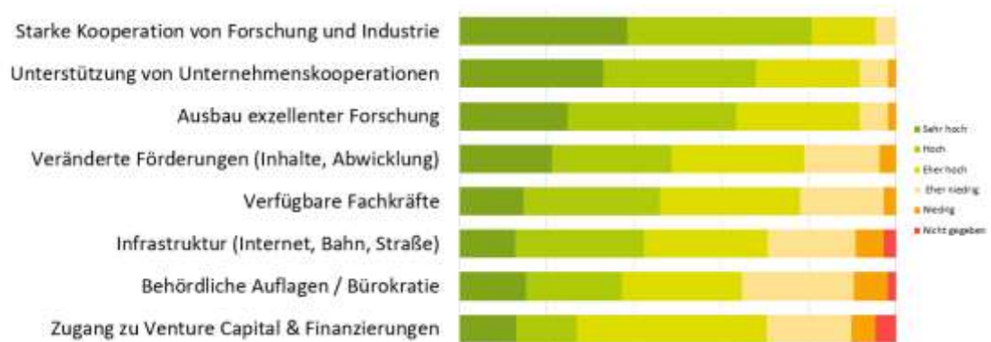
Abbildung 7: Wo sehen Sie Potential zur Weiterentwicklung des Standorts?