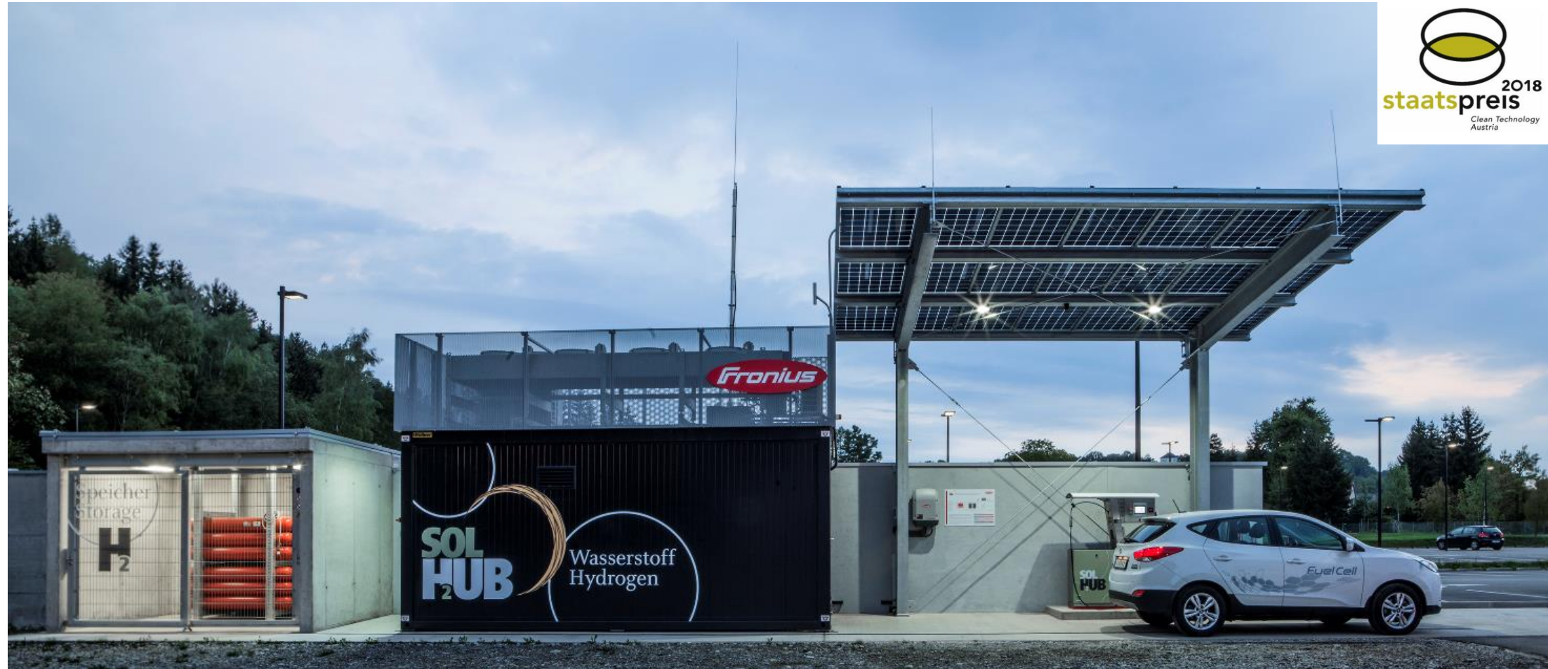
Fronius International GmbH